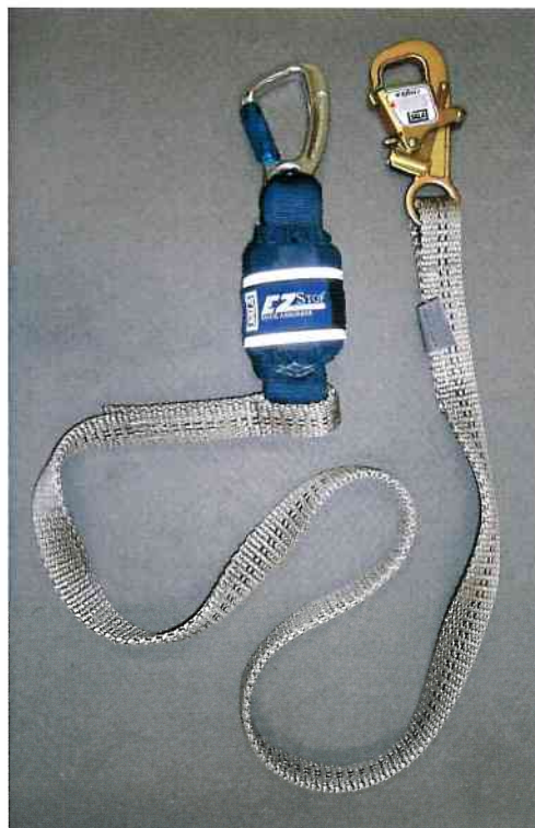
Typ / Type 1245544